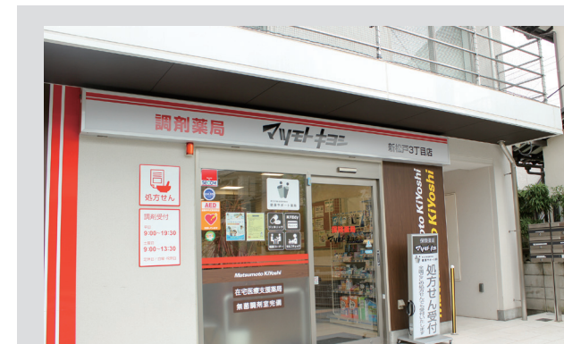
マツモトキヨシ 新松戸3丁目店